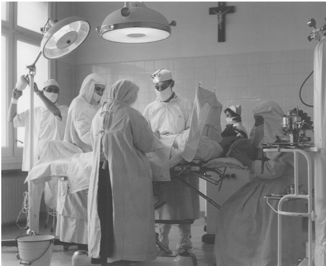
Figures núm. 3 a 5. Instal·lacions de l'hospital i quiròfan.

Malgrat tot, el problema del pressupost es va anar pal·liant amb diversos ajuts que provenien de les donacions econòmiques i la prestació de serveis amb caràcter desinteressat per part de molts habitants de Gavà i Viladecans, canalitzats a través de l'ajuntament i l'església. Como ja se n'ha parlat anteriorment, també els ingressos de la