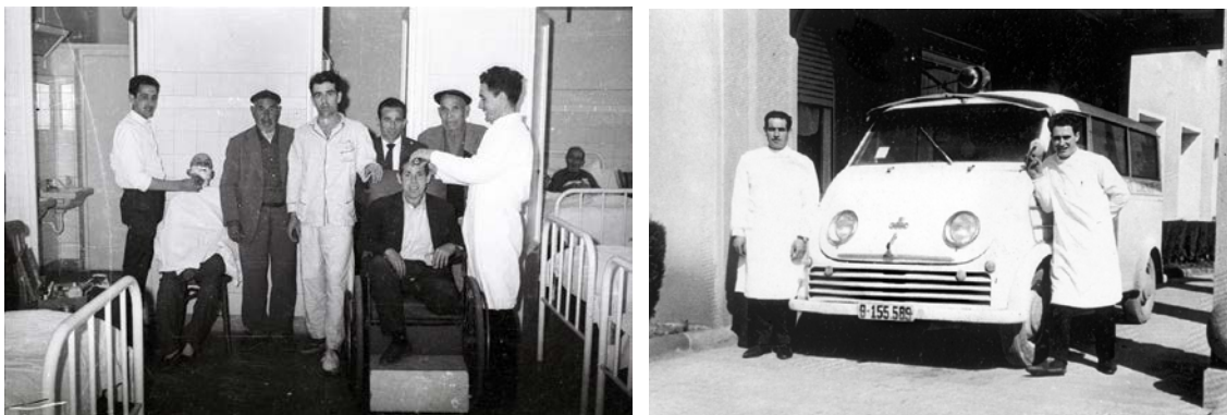
Figures núm. 2 i 3. Personal assistencial, d'infermeria i pacients ingressats.

Gavà i Viladecans i la de l'arquebisbe de Barcelona, Gregorio Modrego. El quadre de serveis mèdics estava al càrrec de "competentes y prestigiosos doctores que se han ofrecido a prestar sus cuidados a la población enferma por pura caridad" 2 , mentre que, de la organització i els serveis de l'hospital s'encarregaven les Hermanas Carmelitas de la Caridad. El nou hospital, amb capacitat de 100 llits, especialment destinats a malalts aguts, disposava d'un soterrani i tres plantes on es distribuïen els serveis de maternitat, radiologia, geriatria, i dispensaris de medicina general y cirurgia, i estava dotat dels avenços tècnics més moderns del moment; es va preveure, a més a més, una reserva d'espais per a futures necessitats assistencials.