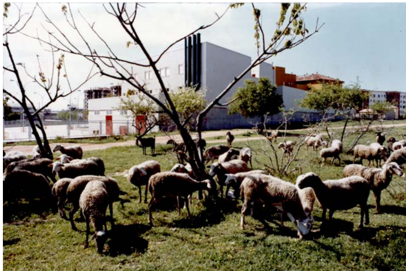
Figura núm. 9. Un ramat d'ovelles pasturant als terrenys adjacents a l'hospital, a la dècada de 1990

funcionar les consultes externes, mentre que, a finals d'any varen tenir lloc els primers ingressos de pacients. Malgrat tot, l'hospital no va funcionar a ple rendiment fins a finals de 1988, quan es va posar en marxa el servei d'urgències de 24 hores.