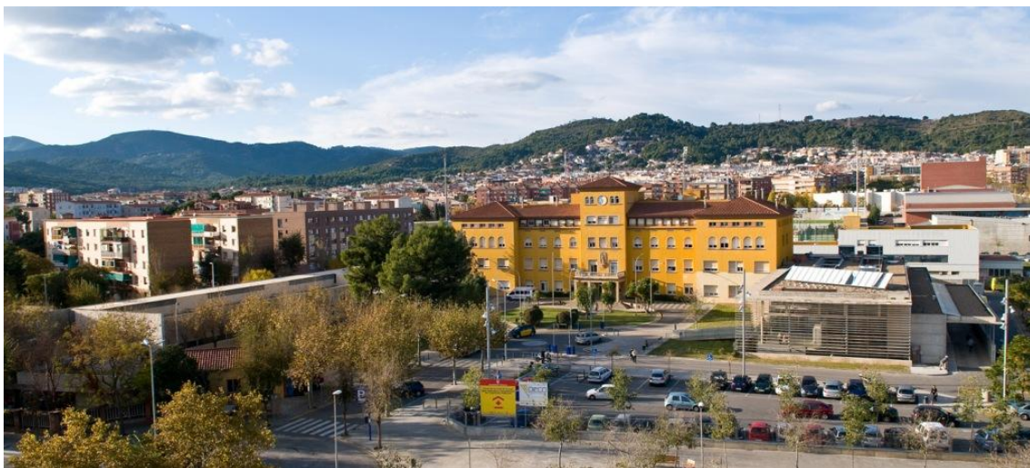
Figura núm. 10. L'hospital de Viladecans actualment

El mes d'octubre de 1990 es va crear la Unitat de Cirurgia sense ingrés, pionera a l'Estat espanyol, on es realitzen procediments quirúrgics i diagnòstics que, tot i l'ús d'anestèsia, no necessiten ingrés.