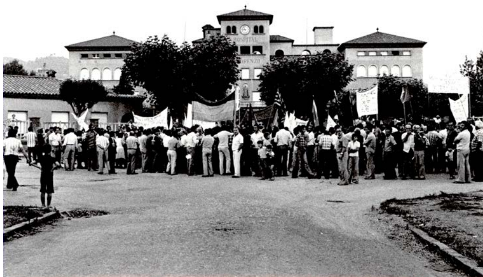
Figura núm. 8. Una de les nombroses manifestacions exigint la reobertura de l'hospital.

Les obres es varen perllongar durant més de quatre anys. Al 1984 es va convocar una manifestació a la qual van acudir més de 4.000 persones per protestar contra la tardança en acabar les obres. Jordi Pujol, president de la Generalitat, va afirmar llavors que l'hospital no s'obriria fins el 1986, per falta de pressupost. Les obres no s'acabaven mai i el desencant dels ciutadans anava augmentant amb el pas dels anys.