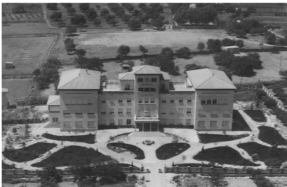
Figura núm. 1. Vista aèria de l'hospital de Viladecans a la dècada de 1950

Un d'ells, Martí Roca Soler, va crear a principis de la dècada de 1950 la Fundació Benéfico-Privada de San Lorenzo 1 (pel patró dels fonedors) amb la intenció de construir un hospital a la veïna població de Viladecans, en terrenys de la seva propietat propers a la fàbrica. La finalitat de l'hospital era, en un primer moment, l'atenció sanitària dels empleats de la fàbrica, encara que aquesta atenció es va ampliar a la població de les localitats de Viladecans i Gavà.