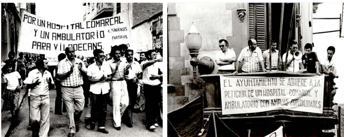
Figures núm. 6 i 7. Manifestacions a favor de l'hospital comarcal al 1978.

Al llarg de la segona meitat del 1978 es varen produir diverses manifestacions per tal de d'assolir que l'hospital adquirís caràcter comarcal i d'aquesta manera pogués ampliar-se la seva capacitat assistencial (més llits, servei permanent d'urgències, especialitats, etc.) per tal de seguir prestant assistència sanitària a les poblacions de Begues, Castelldefels, Gavà, Sant Climent de Llobregat, i Viladecans, amb un total de 98.000 habitants. De la mateixa manera es va reclamar també la construcció de nous ambulatoris a les poblacions esmentades.